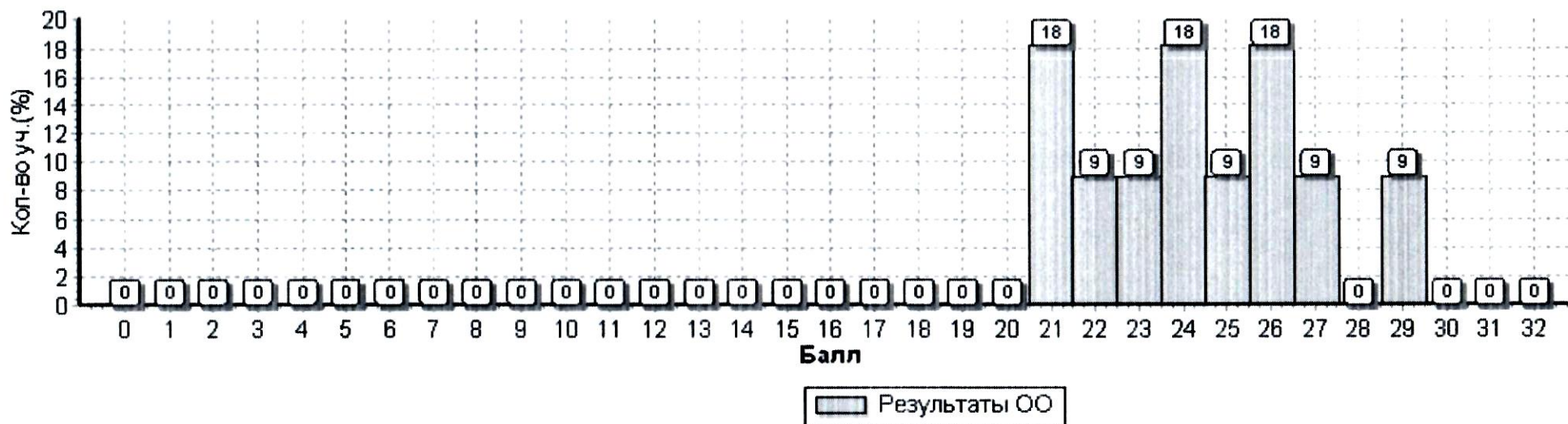
Общая гистограмма первичных баллов