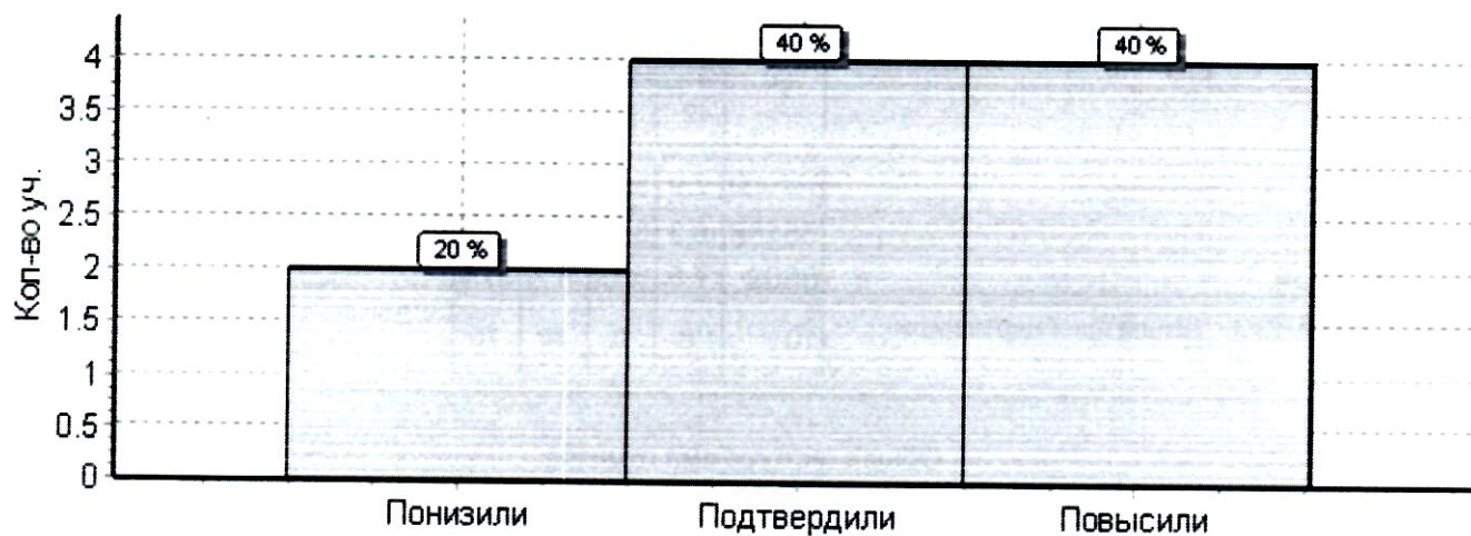
Гистограмма соответствия отметок за выполненную работу и отметок по журналу