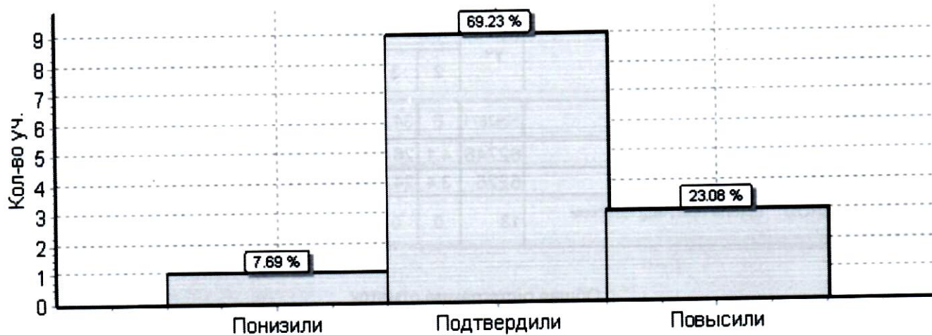
Гистограмма соответствия отметок за выполненную работу и отметок по журналу